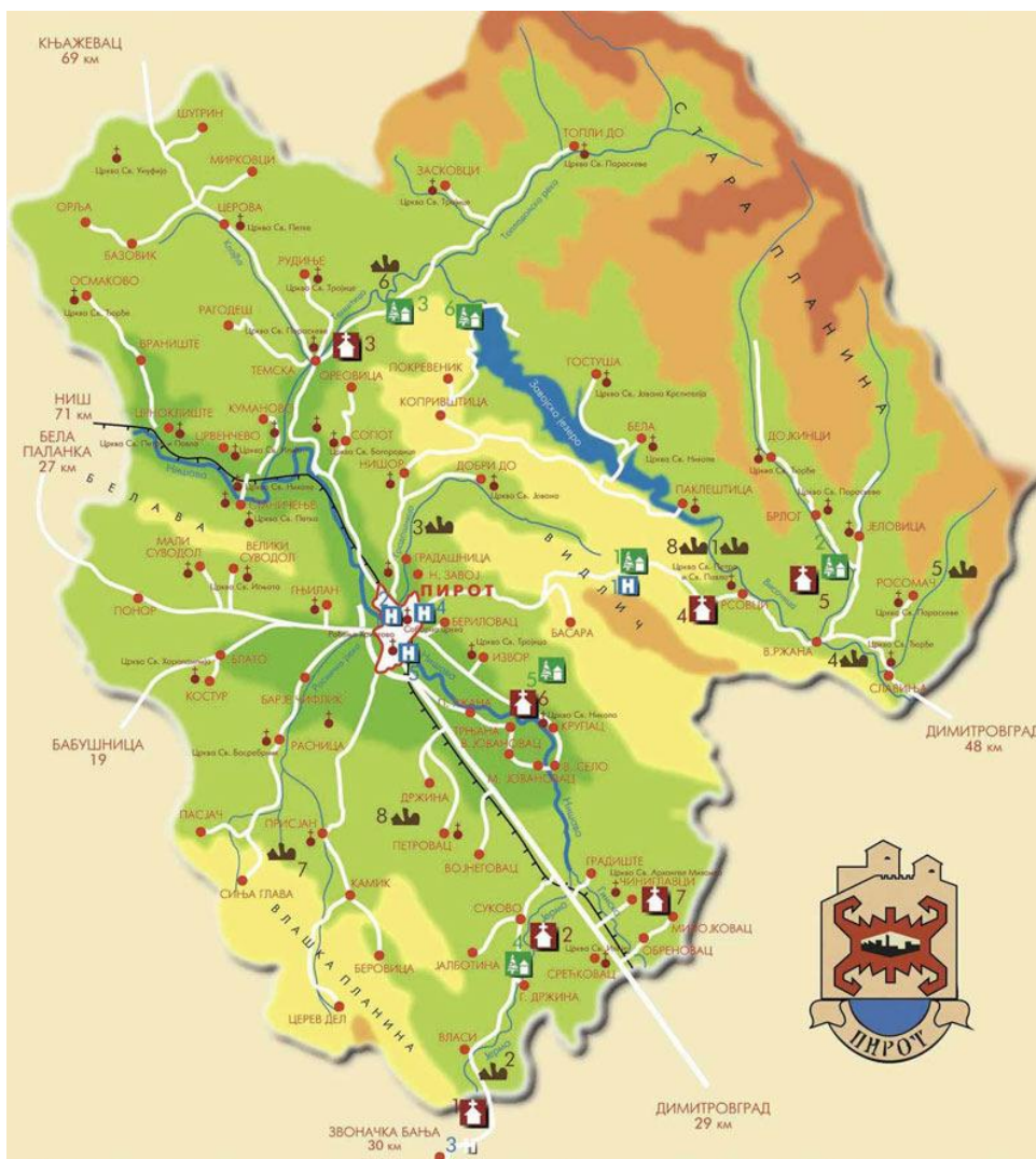
Карта Општине Пирот

Пирот се граничи са општинама Димитровград, Бабушница, Бела Паланка, Књажевац и Републиком Бугарском. На територији општине Пирот постоји 72 насељена места међу којима је и град Пирот са око 40000 становника . Налази се на 368m надморске висине . планински део је најзаступљенији са 40%, па брдски и равничарски са по 30%. Клима у овом крају је умерено континентална са утицајем планинске климе са севера. Од ветрова преовлађавају северни и северозападни. Средња брзина ветра у Пироту је мала, 0,9 м/с. Средња годишња температура износи 11°C. Средња месечна температура најнижа је у јануару -0,8°C, а највиша је у јулу и износи 21,2°C,